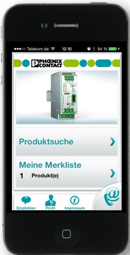
Abb. 3: Katalog App von PHOENIX CONTACT für iPhone und iPad 3

Auf Basis der elektronischen Daten kann eine App für iOS oder Android Tablets oder Smartphones programmiert werden. Diese Form der Kataloge ist im Bereich B2B noch nicht verbreitet, da die Zielgruppe am Arbeitsplatz eher mit stationären Desktop-Systemen arbeitet. Spannend wird das Thema für Produkte, die insbesondere von Servicetechnikern beim Kunden vor Ort benötigt werden. Das Beispiel von PHOENIX CONTACT bietet umfangreiche Navigations- und Suchmöglichkeiten. So sind die benötigten Produkte schnell gefunden und bestellt.