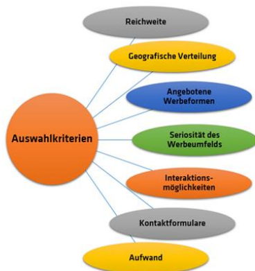
Abb. 5: Die sieben Kriterien bei der Auswahl eines Fachportals 9

Die Auswahl eines geeigneten Fachportals zum Bewerben Ihres Katalogs können Sie anhand von sieben Kriterien vornehmen.