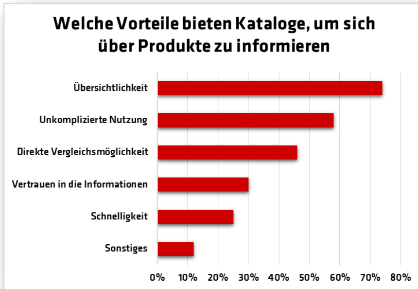
Abb. 1: Katalogverwender lieben die Übersichtlichkeit von Katalogen 1